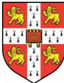
Università di Cambridge