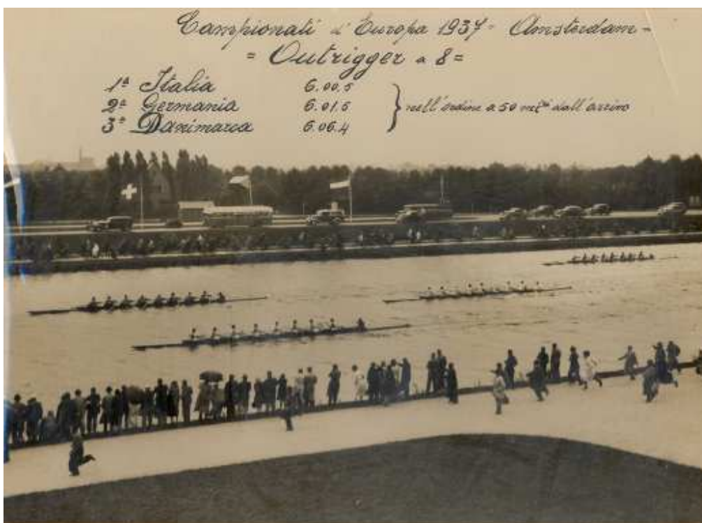
L'arrivo della finale dell'8con ai Campionati Europei del 1937, vinta dall'Italia con un equipaggio della U.C. Livornesi.