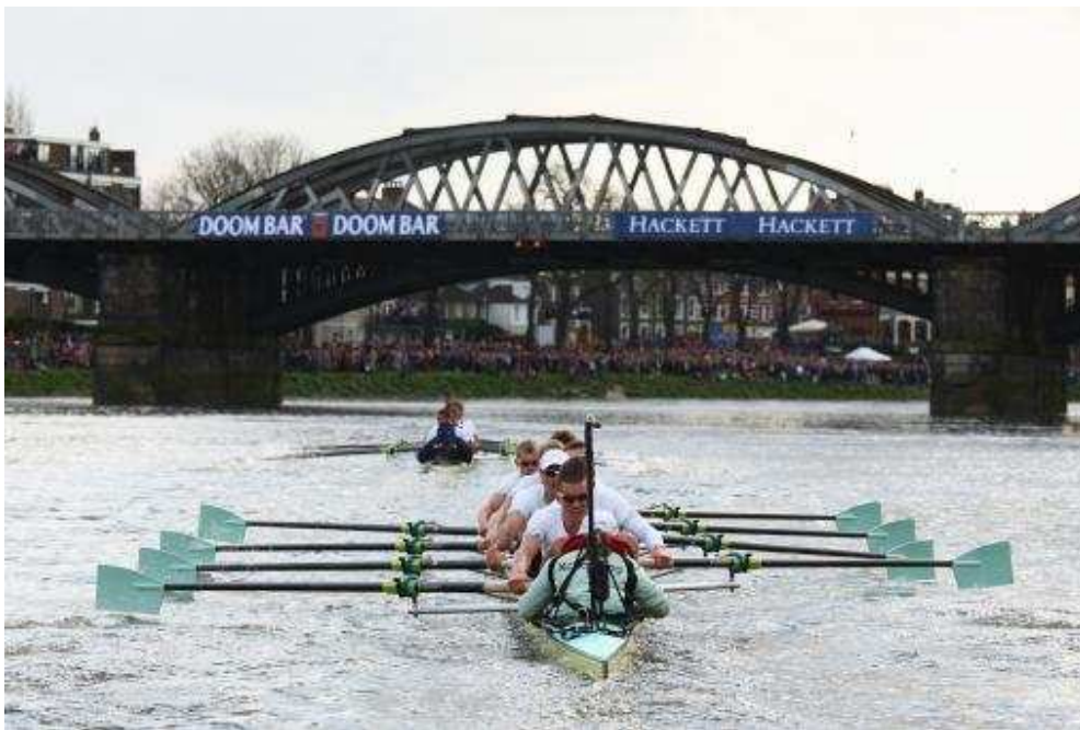
Una fase della 155.a edizione (anno 2009) della Boat Race , vinta dall'equipaggio di Oxford

L'idea di una gara tra due barche a otto vogatori e timoniere, 1 rappresentanti le due più prestigiose università britanniche, venne a due amici: Charles Merivale, studente presso l'ateneo di Cambridge, e Charles Wordsworth (nipote del poeta William Wordsworth), il quale era invece iscritto a quello di Oxford.